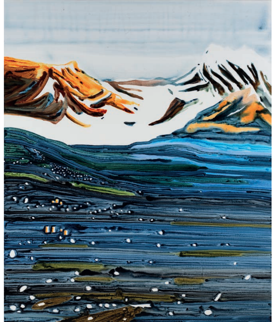
Snow in La Paz JKØ-23-005