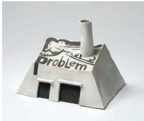
Fabrik 4 JKØS-23-007