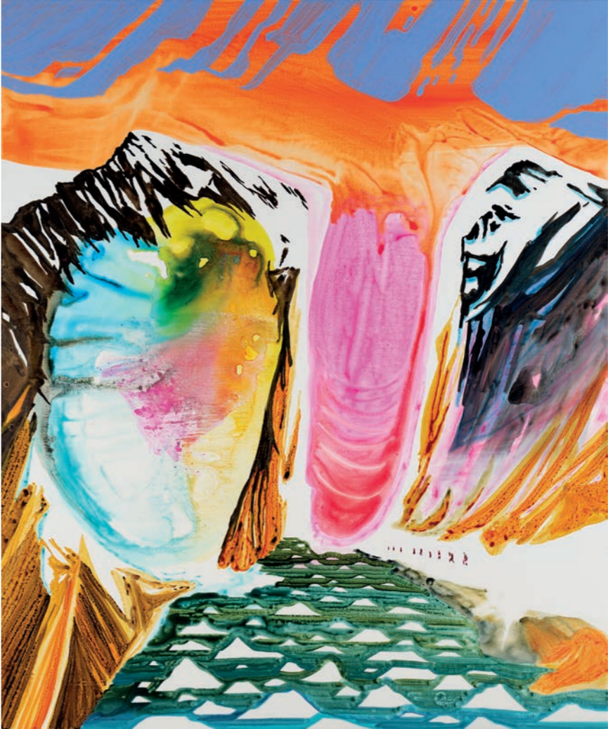
Tongue Hanging Out JKØ-23-009