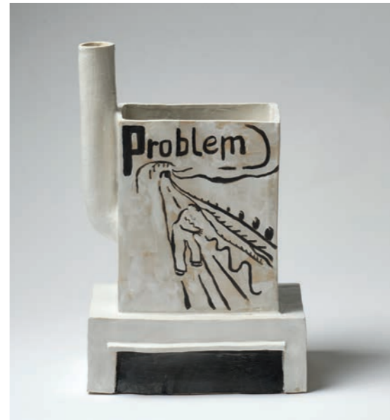
Fabrik 3 JKØS-23-006