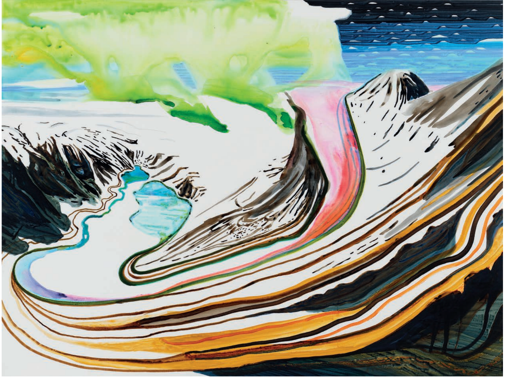
Long Tongue JKØ-23-012