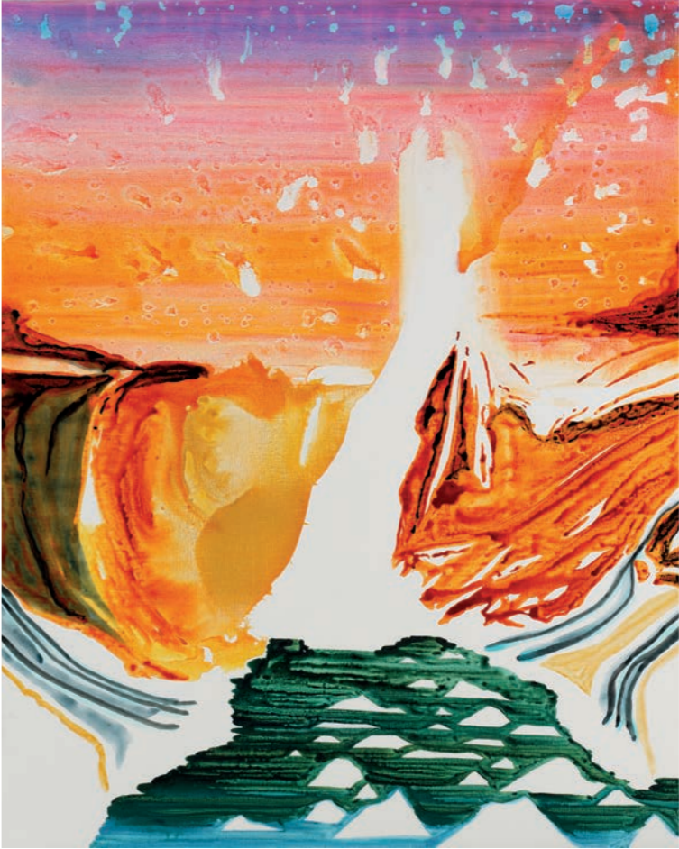
Cold Volcano JKØ-23-007