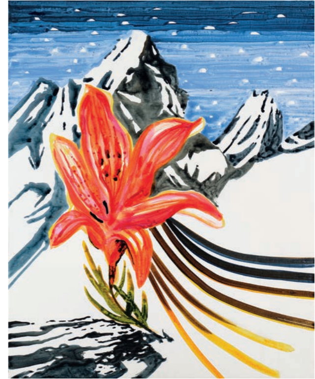
Lilium Bulbiferum with Glacier JKØ-23-011