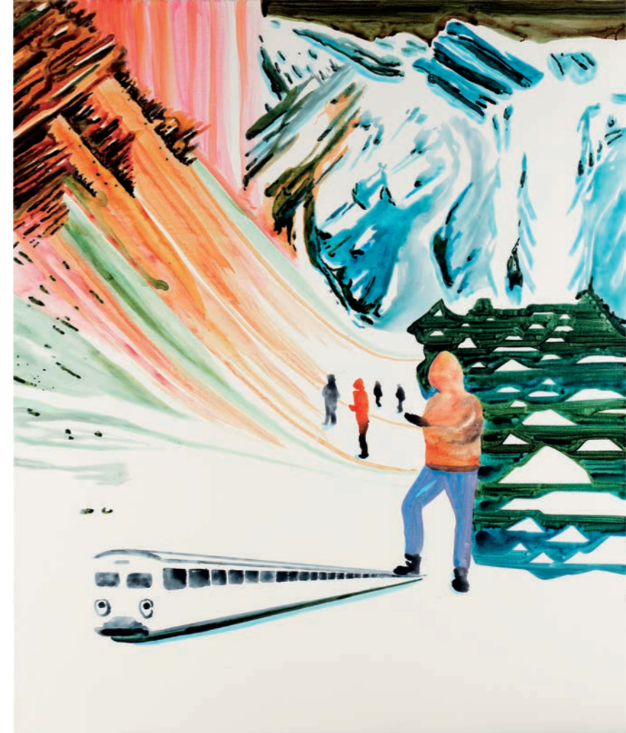
Hoding Back a Train JKØ-23-008

Toke Lykkeberg, "Ekstemporær kunst" (Extemporary Art), in Kunstkritikk , 6 March 2020. Source: https://kunstkruttikk.dk/ekstemporær-kunst/ The Greenland Ice Sheet: 80 Years of Climate Change Seen from the Air , Natural History Museum of Denmark, University of Copenhagen, 2013. Lykkeberg, op. cit.