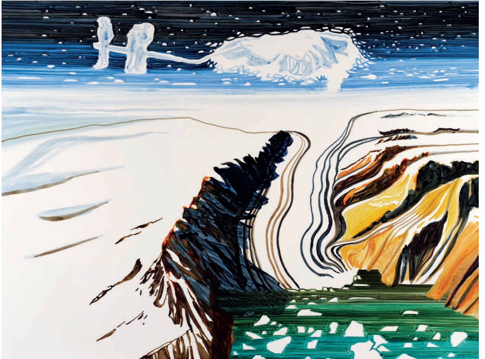
Tongue Out JKO-23-014