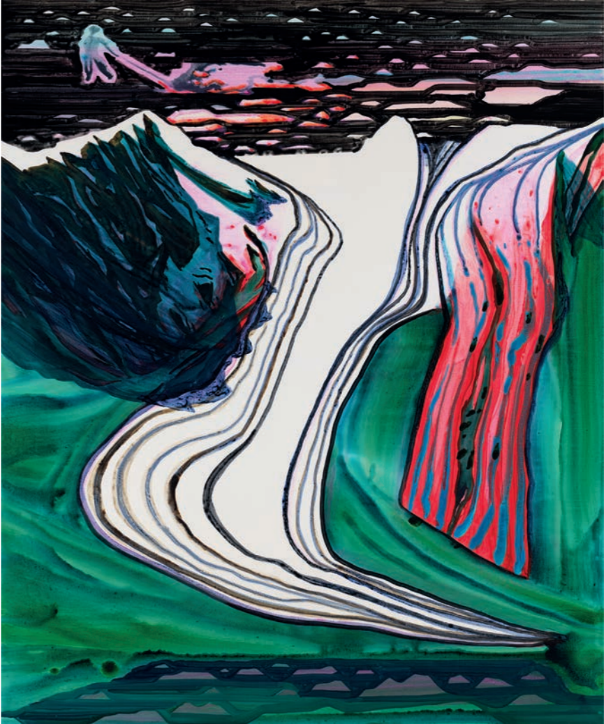
Sky Blinking Red JK0-23-010