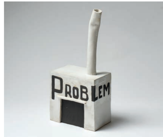
Fabrik 2 JKØS-23-005